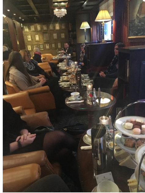
Fra Afternoon tea på Bristol

Vi har hatt følgende arrangementer i 2018: